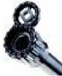
Zielvorrichtungen jeglicher Art