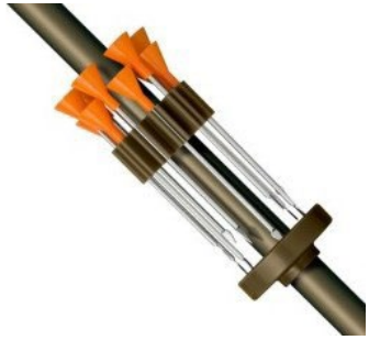
Pfeilhalter jeglicher Art